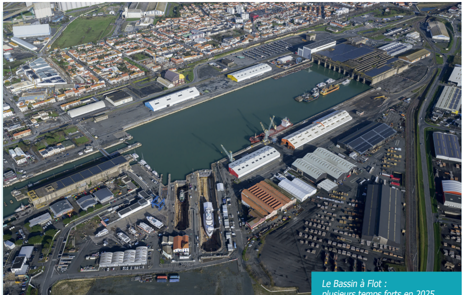
Le Bassin à Flot : plusieurs temps forts en 2025

L'ensemble de ces grands aménagements représente la fin d'un cycle. L'heure est à la préparation du Port de demain avec, dans l'immédiat, la finalisation du nouveau projet stratégique qui va accompagner la communauté portuaire jusqu'en 2029.