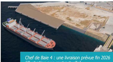
Chef de Baie 4 : une livraison prévue fin 2026 (Illustration non contractuelle)

Nouvel outil également, exploité prochainement par l'opérateur AMLP : le terminal de Chef de Baie 4, pour la construction duquel le Port a signé un prêt de 15 millions d'euros avec la Banque des Territoires. Bientôt engagés, les travaux s'achèveront au troisième trimestre 2026 pour livrer un quai de 160 mètres et une plateforme de 4 hectares. C'est ensuite à fin 2028 que le Port se projette, avec la fin de la phase de réhabilitation du viaduc du Môle d'Escale, programmée à partir d'avril prochain.