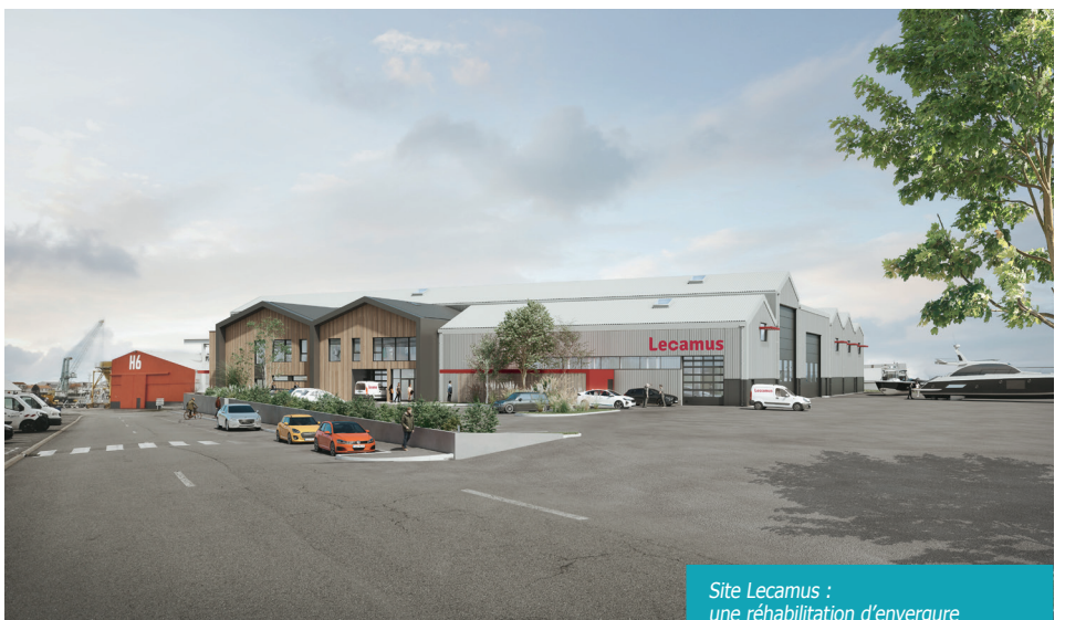
Site Lecamus : une réhabilitation d'envergure

la mutation du Bassin à Flot (voir par ailleurs). Phasés sur quatre ans pour ne pas impacter l'exploitation, les travaux vont démarrer au printemps sur cet ensemble immobilier de 4 000 m 2 construit entre 1944 et 1946, initialement destiné à recevoir une partie des ACRP (Ateliers et Chantiers de La Rochelle-Pallice). Outre les différentes mises à niveau, les interventions porteront sur la construction de nouveaux bureaux, l'isolation du bâtiment, le renforcement des charpentes ainsi que sur la refonte du terre-plein attenant.