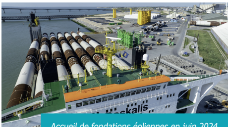
Accueil de fondations éoliennes en juin 2024

Faire preuve d'ambition pour le Port, c'est aussi assurer l'évolution de ses infrastructures pour servir les besoins du territoire. 2024 a connu à ce titre plusieurs temps forts : achevé en début d'année, le terre-plein de l'Anse Saint-Marc 3, ajouté à celui de l'Anse Saint-Marc 2, a permis le transit des fondations d'éoliennes offshore destinées au parc d'Yeu-Noirmoutier dans des conditions optimales, transit prévu pour s'achever en avril 2025. Les premiers mois de 2024 ont également été ceux des travaux de dragage et de déroctage précisément dans l'objectif d'être en adéquation avec la filière de l'éolien en mer et, plus globalement, de répondre à l'augmentation de la taille des navires. Autre réponse à des besoins exprimés, la création d'une plateforme civile et militaire à La Repentie. Développée sur 7 hectares, c'est le nouvel outil de type combiné rail-route pour la place portuaire, cofinancé à hauteur de 1,9 million d'euros par l'Europe.