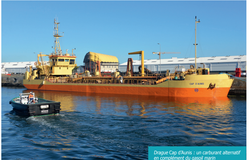
Drague Cap d'Aunis : un carburant alternatif en complément du gasoil marin

L'ambition environnementale de l'autorité portuaire se retrouve dans tous ses projets, comme celui portant sur la réhabilitation de l'ex-hôtel restaurant La Jetée Sud, acquis par le Port. Ce projet éco-conçu a été salué dans le cadre de la démarche Bâtiment durable Nouvelle-Aquitaine, référentiel qui comporte 300 critères en lien avec la