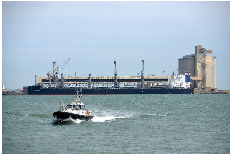
Thierry Rambaud / PALIR

Malgré ce regain d'activité, des défis persistent pour l'avenir : les conditions météorologiques lors des semis interrogent sur les rendements de la prochaine campagne. Les espèces semées ont évolué en termes de répartition : moins de blé tendre, mais plus d'orges, de maïs, de blé dur et de tournesol. Il demeure alors nécessaire pour Sica Atlantique de rester flexible et de s'adapter pour maintenir sa position sur le marché mondial des céréales. »